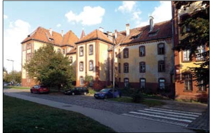
Fot. Ehemalige Kaserne (J. Thielsch)