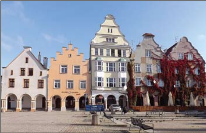
Fot. Altstadt (J. Thielsch)