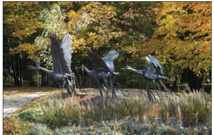
„Ermländische Kraniche“ im Stadtzentrum