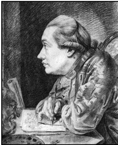
Fot. Kniep. Selbstporträt, Quelle: wikipedia.org

ger als ein paar oder mehrere Wochen dauern konnte. Andererseits kann man den Informationen über Knieps Leben und Wirken entnehmen, dass er, nachdem er Preußen verlassen hatte, in der am Vesuv gelegenen Stadt Neapel ansässig wurde und dort verstarb.