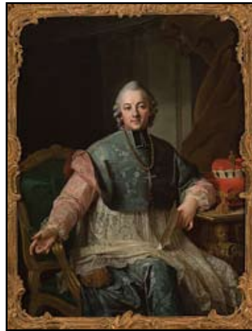
Fot. Krasicki als Fürstbischof von Ermland in Chorkleidung, Ölgemälde von Per Krafft dem Älteren, Quelle: wikipedia.org

Die meisten Informationen über Knieps Persönlichkeit und Fähigkeiten lieferte aber Goethe in einer gelehrten Beschreibung seiner Italienreise. Am 23. März 1787 notierte er: