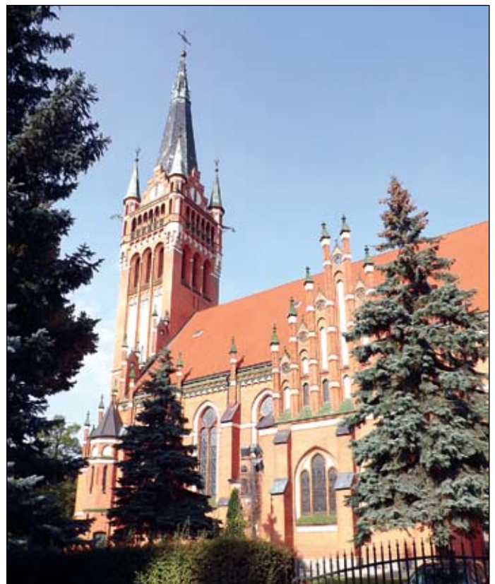
Fot. Herz-Jesu-Kirche (J. Thielsch)